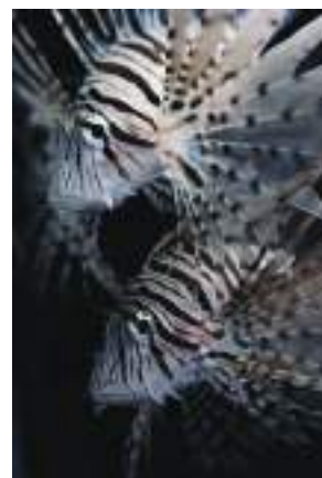
Χιλιάδες είδη φυτών και ζώων που υπήρχαν το 1972 έχουν σήμερα εξαφανισθεί.