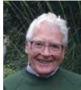
James Ephraim Lovelock 1919) είναι

Όποιος ελπίζει ότι « το κακό ζει αιώνια » πάσχει απ’ το σύνδρομο του Τιτανικού. Όποιος πιστεύει ότι οι πυρηνικές δοκιμές και οι προετοιμασίες ενός πυρηνικού ολοκαυτώματος που θα το ξεκινήσει « όποιος θυμώσει πρώτος », δεν ανεβάζουν τον πυρετό