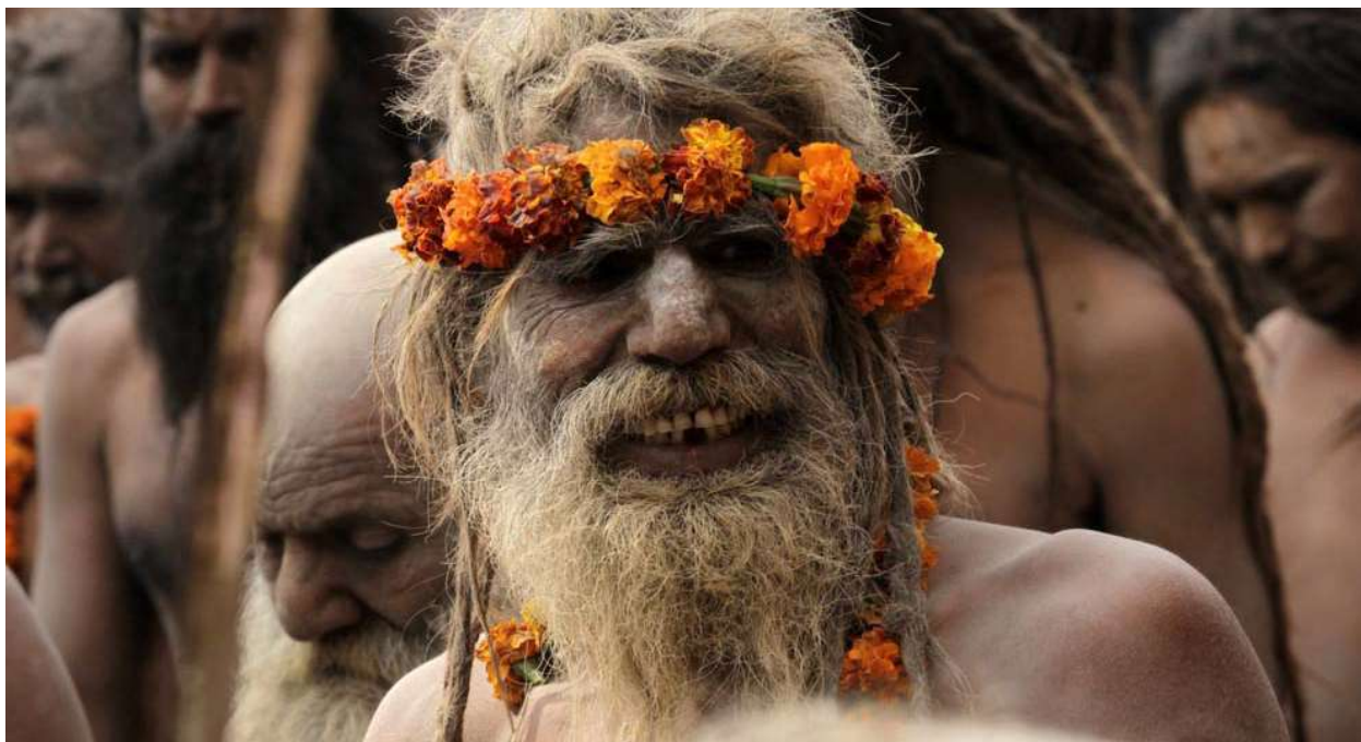
Οι Γκουρού έχουν το δικό τους πνευματικό κοινόβιο, με εξ αποστάσεως επικοινωνίες αλλά και συσχετισμούς τρόπου ενεργειών.

Ένας δεύτερος λόγος είναι ότι, τα γήινα κριτήρια σε έναν άνθρωπο φαινομενικά δυστυχή και έναν άνθρωπο φαινομενικά ευτυχή, δεν έχουν καμία απολύτως σχέση με του Νόμους και τις Αρχές του Θεού κόσμου.